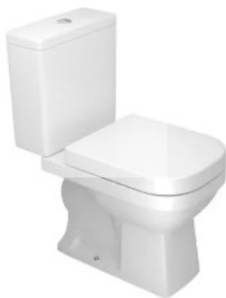
Referência de bacia sanitária com caixa acoplada