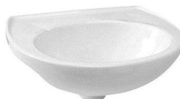
Referência de lavatório suspenso