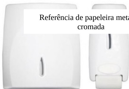
Referência de papeleira metálica cromada